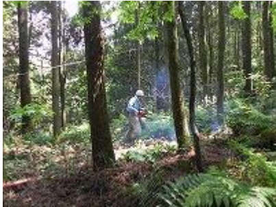
チェーンソーを使い効率よく