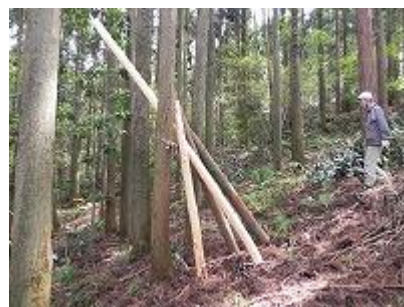
皮剥きをして、材として利用