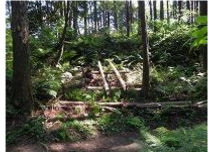
杉の皮むきもした