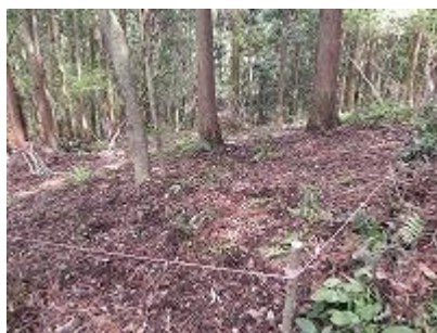
落ち葉掻き後 調査域を指定