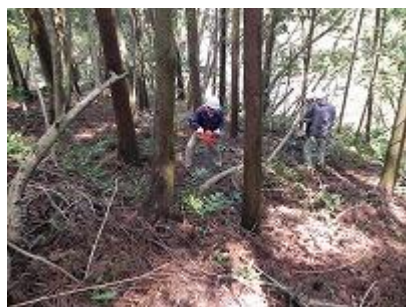
チェーンソーも使って