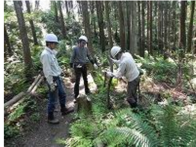
散策路境界に杭打ち