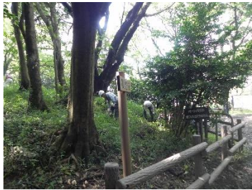
体験教室参加者 小さな子供たちの安全に配慮しての除草作業