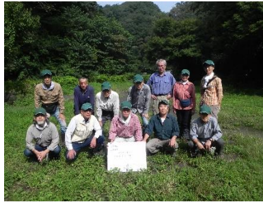
活動メンバー 集合写真