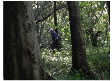
チェンソー大活躍