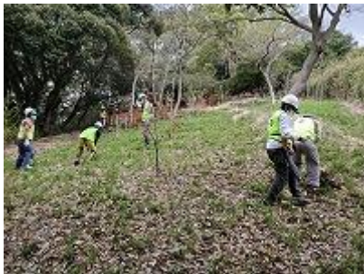
道場丸での笹刈り

③当初予定であった道場丸での食事(弁当)は雨の為中止し舞上線ガード下での配布となった。