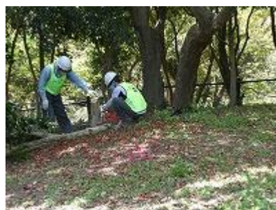
チェーンソーでカット