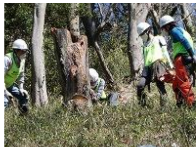
チェーンソーで伐採