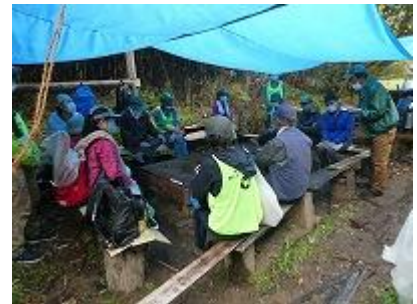
ターフの下での打ち合わせ