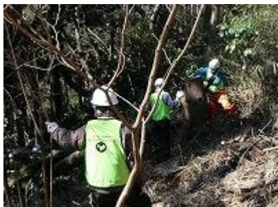
いっしんどう下の整備