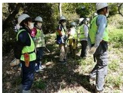
道場丸で植物の説明