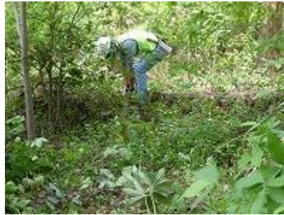
チェンソーを使い玉切り