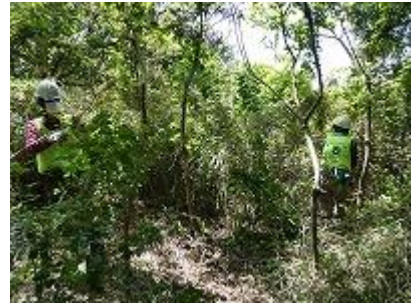
南斜面は伸び放題の笹