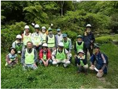
活動前に参加者で