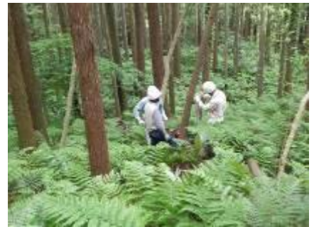
どっちに倒そうかな