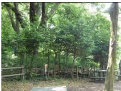
剪定前のヒサカキの植栽

●打合せ事項 ・林野庁交付金申請には、オオタカの住環境の保存・維持を最終目的と設定