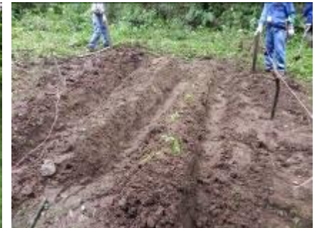
作製した畝に幼木を移植