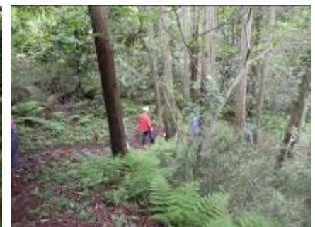
旧研修地下の申請地の下調べ