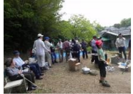
ご馳走になります

(2)平成 29年5月14日(日) 曇り 9:30~14:00 北谷戸:苗床の作製と交付金申請地の下見