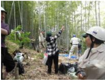
久しぶりの蹴っ飛ばし