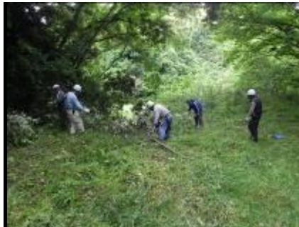
苗床の為下草刈り