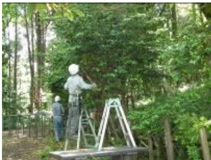
剪定中、どれを切ろおかな?