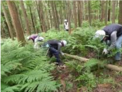
不要スギの伐採、力を併せて