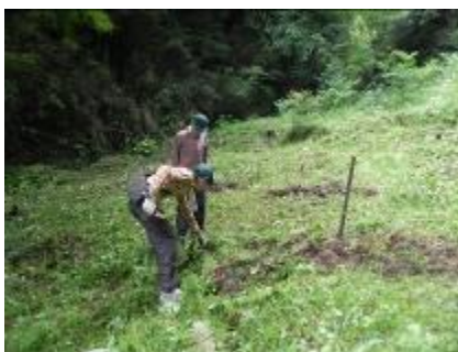
コナラ、モミジ等の実生樹の採取