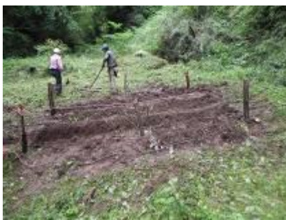
畝の周囲に囲いを作る