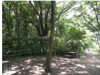
剪定後のクサカキの植栽