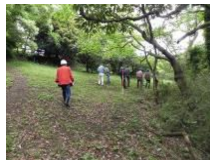
道場丸広場の申請地の下調べ