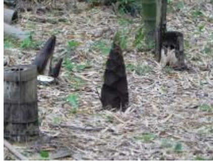
蹴っ飛ばされる運命の筍