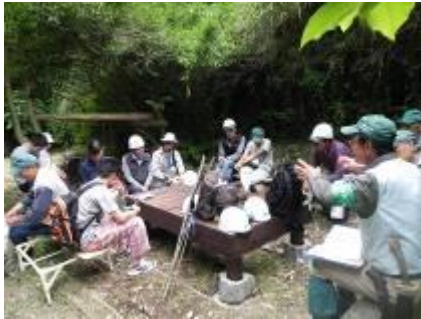
新しく出来たテーブルを囲んで